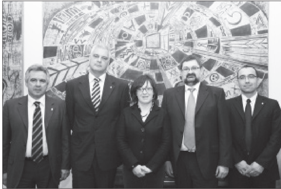
Для итальянской делегации ВолГУ может стать хорошим началом в плане международного сотрудничества в сфере образования.