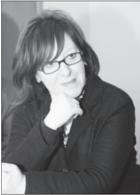
Мэр Олевано Романо Ринальди Гульельмина.

У Волгограда появился новый город-побратим – итальянский Олевано Романо, небольшой городишко с огромными амбициями в области международного сотрудничества. В конце января представители власти Олевано Романо приехали в Волгоград с официальным визитом, посвященным также 68-летию со дня окончания Сталинградской битвы.